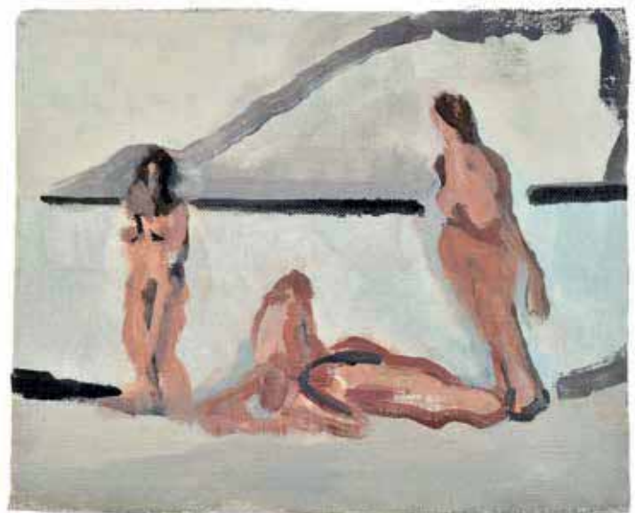
Emma Shoring, 'Luxe, calme et volupté 1', 2014. Olieverf op doek, 21 x 17,5 cm. © De kunstenaar. Met toestemming van L'Orangerie. Prijs: € 1.000 tot € 5.000.

Raphaël Decoster, 'Gens'. Inkt op papier, 21 x 29,7 cm. © De kunstenaar. Prijs: € 100 tot 400.